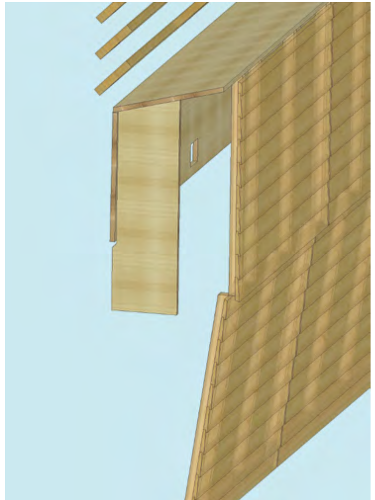
Die Blendschutzbretter wurden in 6 verschiedenen Bearbeitungsvarianten geliefert.