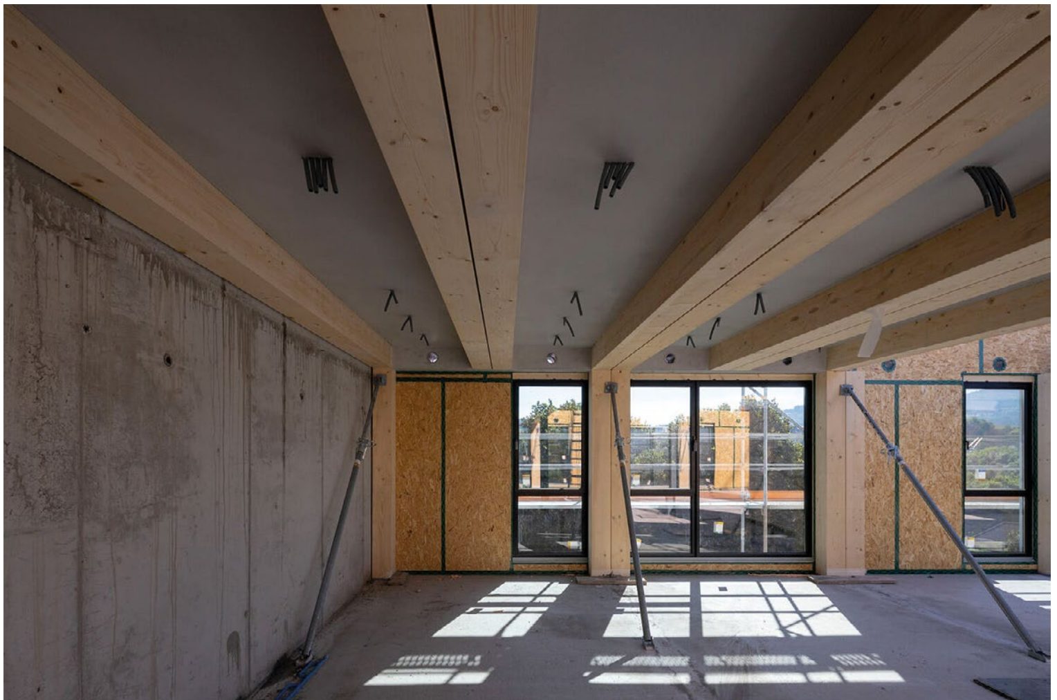
Die hybriden Bauteile Holz-Beton bei der Montage und nach der Montage.