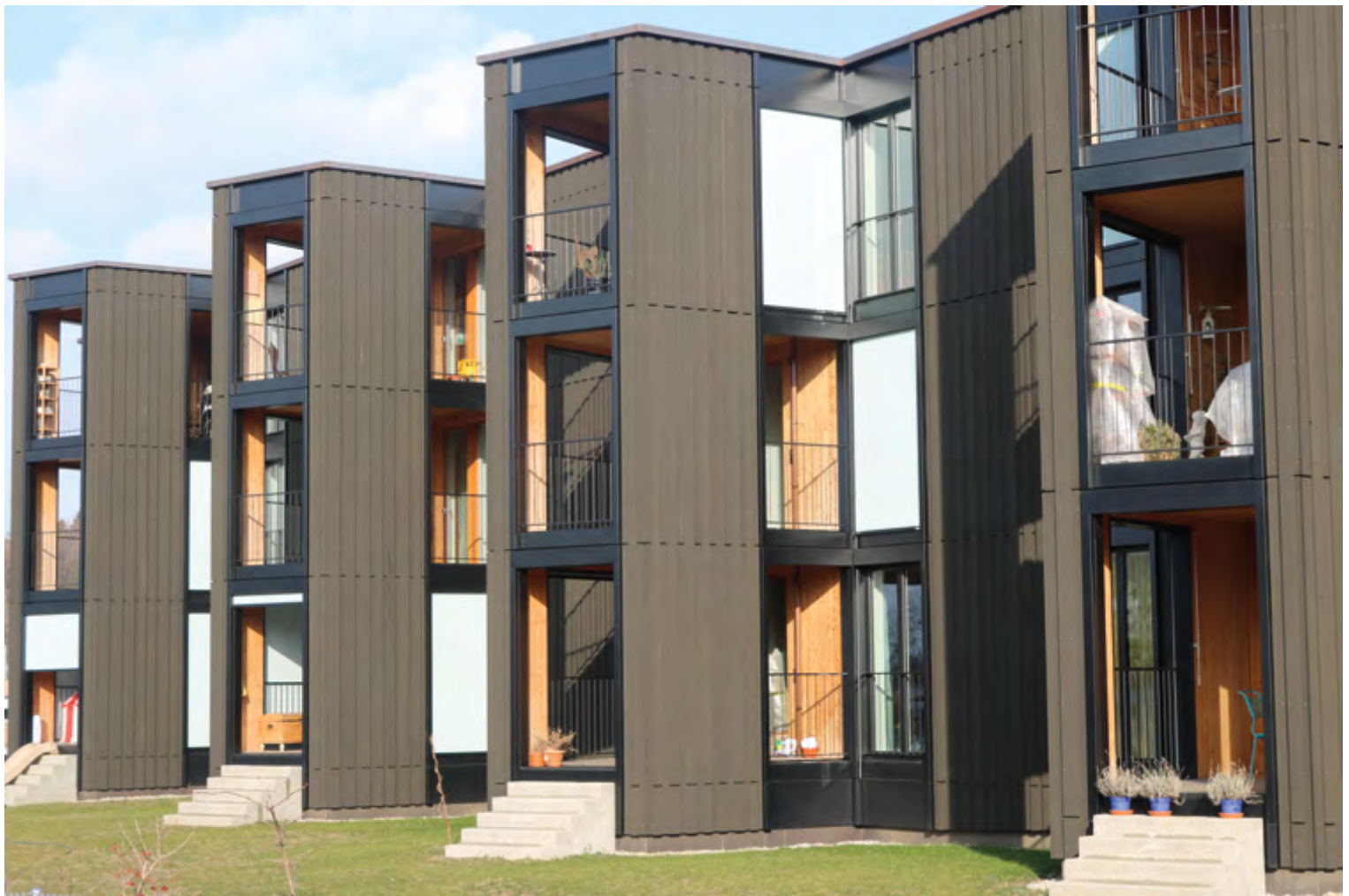
Der rötliche Farbton der Douglasie-Grossformatplatten harmoniert perfekt mit der in blaugrau gehaltenen Fassade.