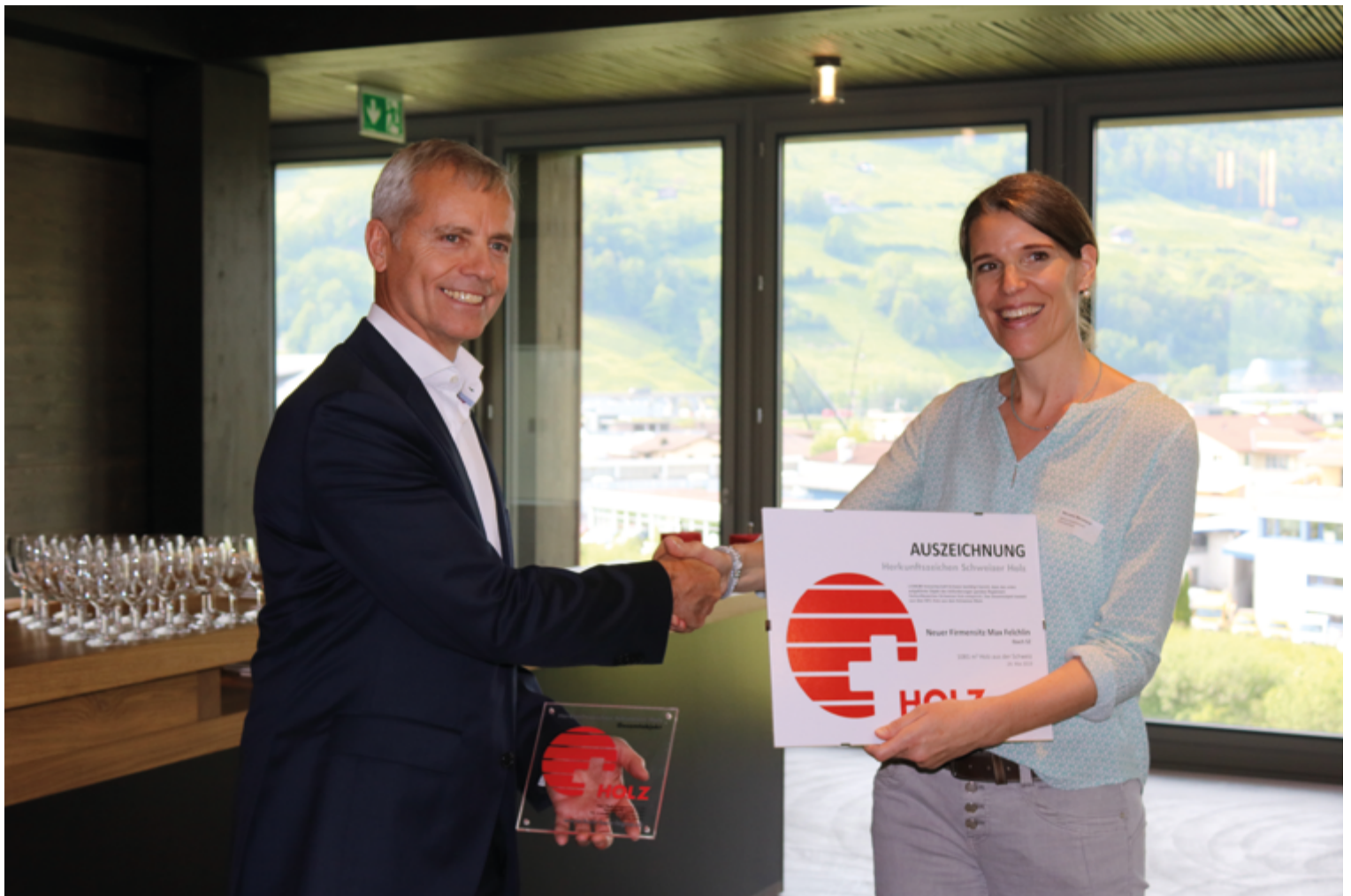
Le bâtiment représentatif est certifié COBS (Certificat d'origine Bois Suisse).