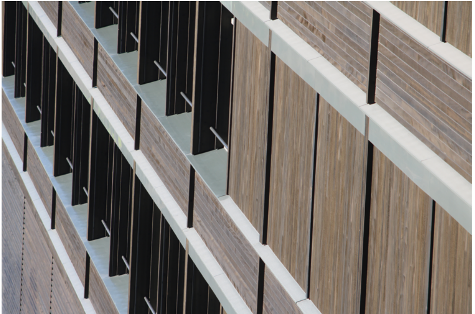
La façade a été planifiée et exécutée selon deux techniques différentes.