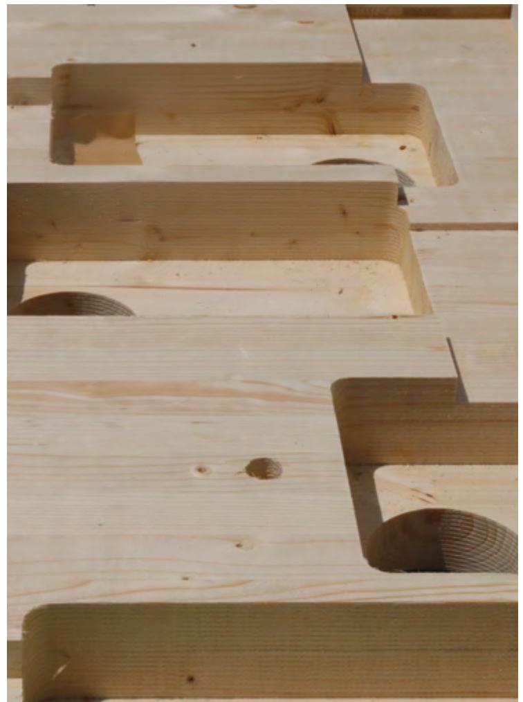
Für die vier Häuser durfte Schilliger Holz AG über 5600 m 2 Massivholz-Bodenplatten erstellen und abbinden.