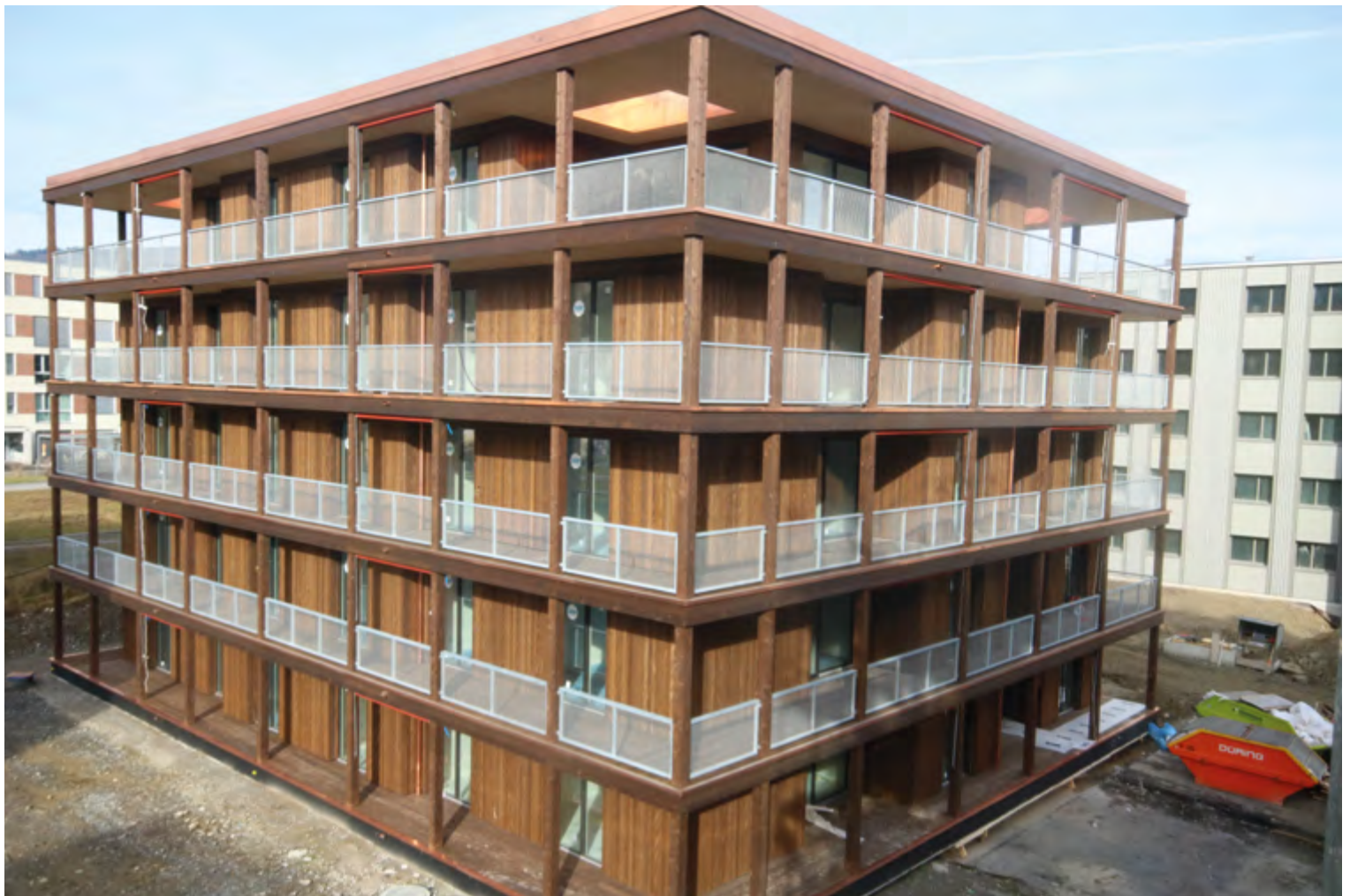
Das Resultat: Holzbauten, die sich sehen lassen dürfen.